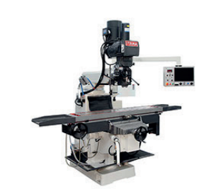
ITAMA FV30 MULTITRONIC con testa birotativa x 1.300 y 400 z 350