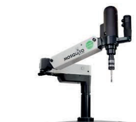
MASCHIATRICE ROSCAMAT MOSQUITO