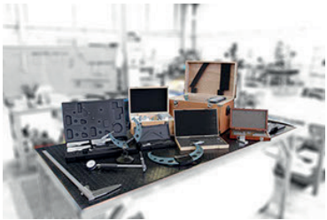
STRUMENTI DI MISURAZIONE