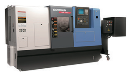
DOOSAN LYNX 220 LM con assi motorizzati max diametro tornibile 350 lunghezza 500