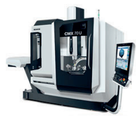
DMG MORI CMX 70 U x 750 y 600 z 520 ASSE B – 5° + 95° ASSE C 360°