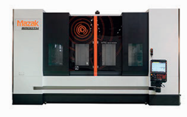
MAZAK VTC 800 SR x 3.000 y 800 z 720 ASSE B ± 110°