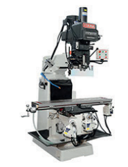
N° 2 ITAMA FV40 con testa birotativa x 1.000 y 350 z 400