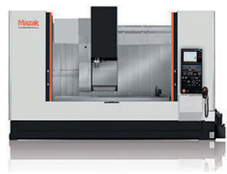
MAZAK NEXUS VTC 530C con quarto asse x 1.800 y 530 z 530 asse C diam. max 250 lavorazione con asse in continuo