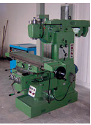
FRESATRICE UNIVERSALE con testa birotativa e frontale x 1.200 y 450 z 500