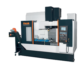
MAZAK NEXUS VCS 530C x 1.070 y 530 z 530